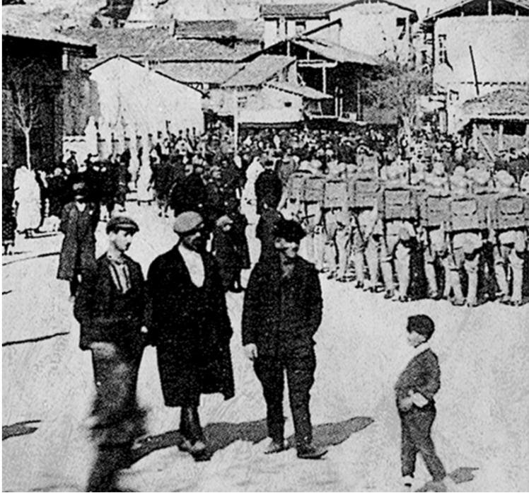
Kadım Őehrin Kadım Manzaralarından

Gariplerde gariğe bir fıgan, Boynu bükük kalmıő kapıda duran Bir deęil olsa da binlerce aęlayan, Orda her derde derman bulunur. Őiirini anlamakla olur.